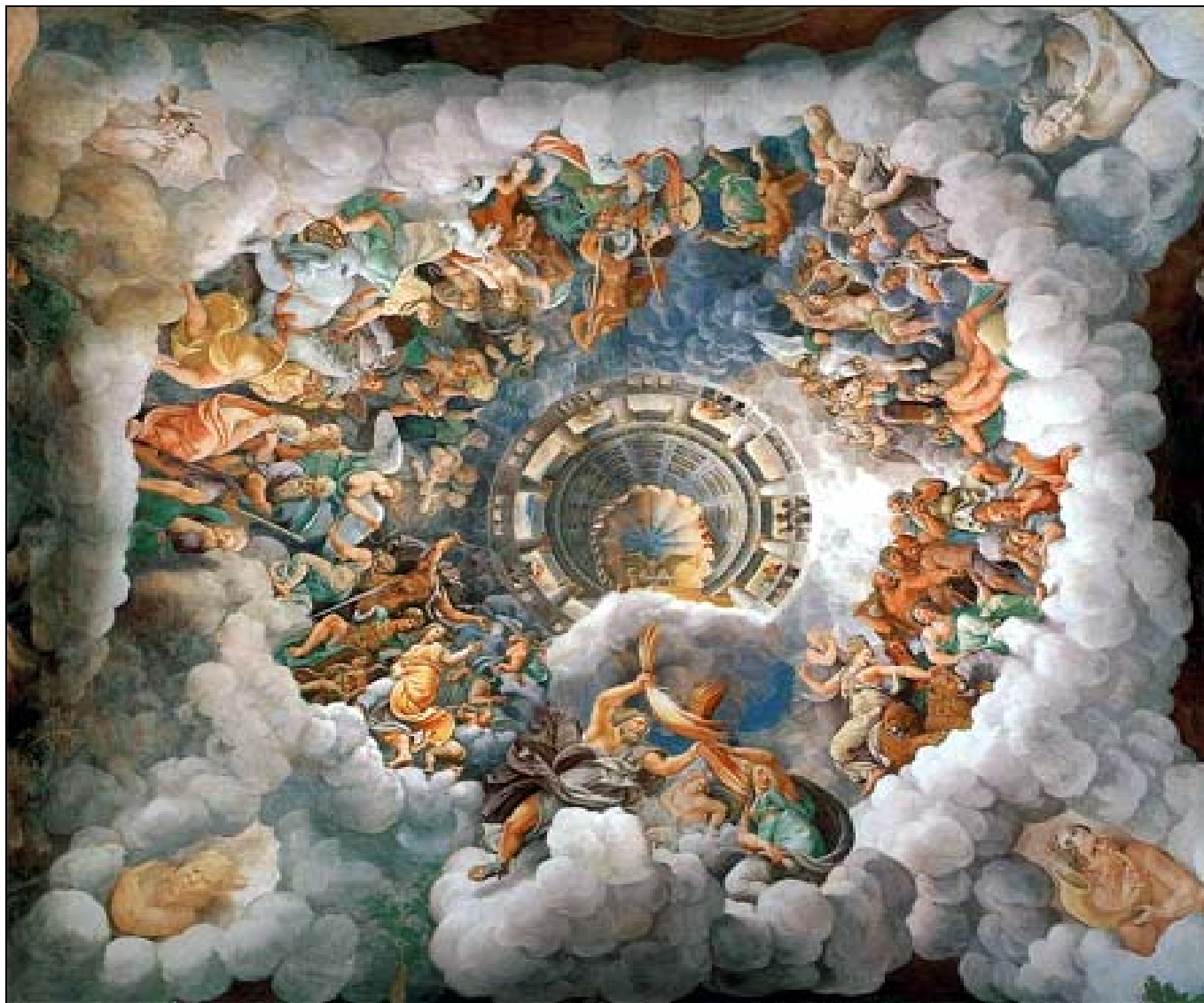
Джулио Романо. «Олимпийские боги» Роспись плафона в зале Гигантов г. Мантуя, Италия

В Древней Греции было две группы богов: титаны - боги второго поколения (шесть братьев - Океан, Кей, Крий, Гипперийон, Иапет, Кронос и шесть сестер - Фетида, Феба, Мнемосина, Тейя, Фемида, Рея) и олимпийские боги - олимпийцы - боги третьего поколения. В число олимпийцев входили дети Кроноса и Реи - Гестия, Деметра, Гера, Аид, Посейдон и Зевс, а также их потомки - Гефест, Гермес, Персефона, Афродита, Дионис, Афина, Аполлон и Артемида. Верховным богом был Зевс, лишивший власти отца Кроноса (бога времени).